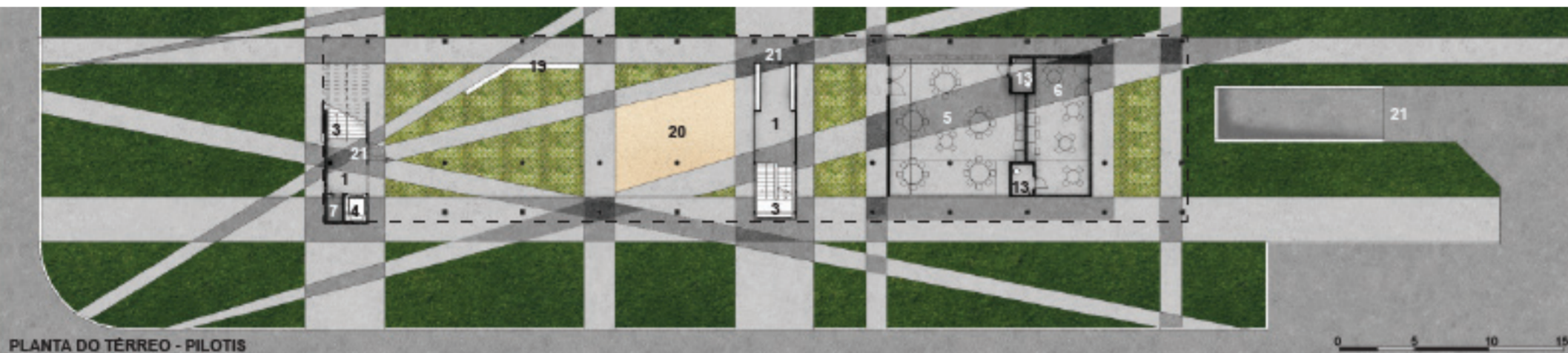
PLANTA DO TERRENO - PILOTIS

O emprego de cores reforça a unidade do conjunto e possibilita a criação da paisagem urbana que falta ao local. Em cada edifício uma cor diferente é predominante, o que permite que os blocos sejam vistos e identificados à distância, trazendo identidade para cada quadra e o sentimento de pertencimento a cada grupo de moradores.