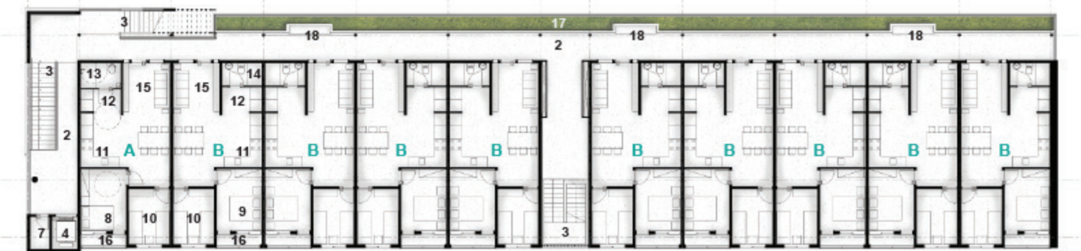
PLANTA DO 1º PAVIMENTO - TIPO